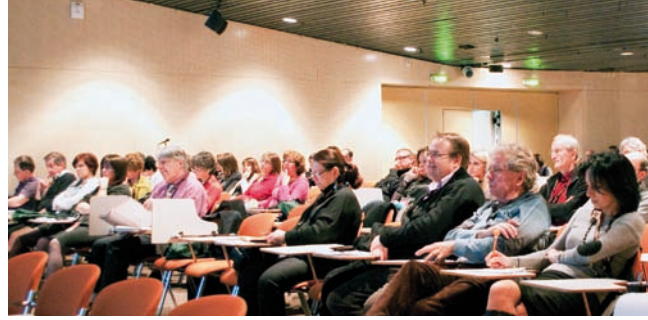
TABLE RONDE RELATIONS HUMAINES, CONTRAINTES BUDGÉTAIRES :

QUELLE AIDE AU MANAGEMENT POUR LES DIRECTEURS AU SERVICE DES PERSONNES ÂGÉES.