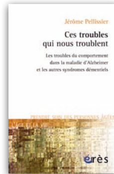
Ces troubles qui nous troublent de J. Pellissier Érès - 392 p - 18 €

gestes, pour que ces personnes hypersensibles vivent le mieux possible ce qu'elles ont tant de mal à comprendre ?